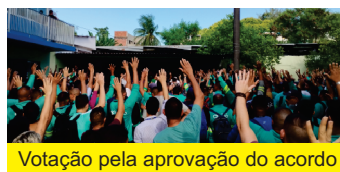
Votação pela aprovação do acordo